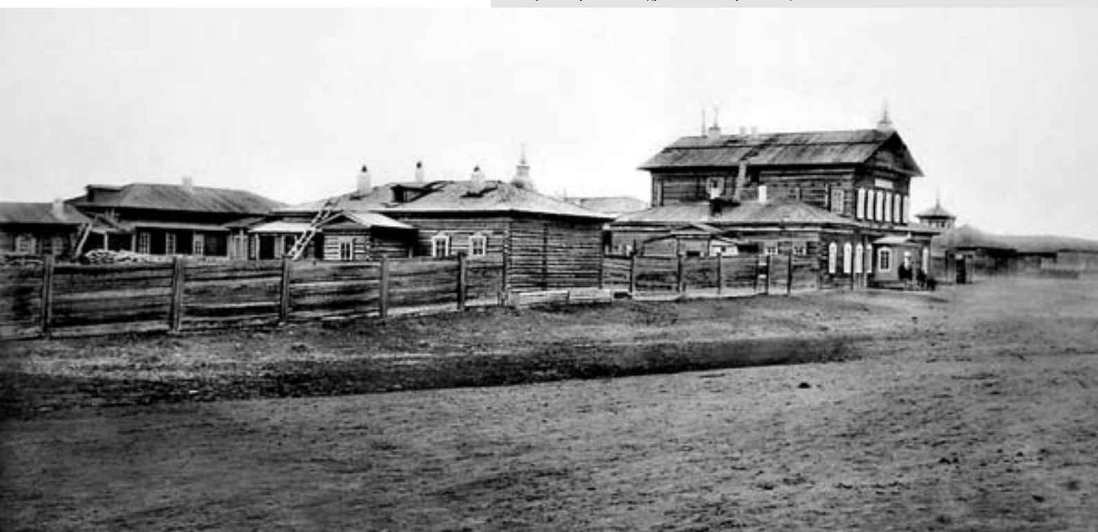
Якутская Православная духовная семинария. Конец XIX века

положено начало к систематическому просвещению северных инородцев. Наконец, в самом Якутске урегулирована, страдавшая нестроениями, церковная жизнь, несомненно мешавшая делу проповеди христианства. С отъездом Преосвященного не замерла церковная жизнь в Якутском крае. Оставленный им, архимандрит Нафанаил показал себя ревностным служителем Церкви. Еще в 1734 г. в данной ему инструкции, при назначении в Якутск, между прочим, значилось: «собрать тебе во всем заказе твоём по указу Ея Императорского Величества, как священнических, так и причетнических в монастырь твой от 7 до 18 лет, обучая грамоте славяно-российской» 12 , чтобы дать возможность духовенству иметь своих грамотных преемников. Содержание же для школы, Преосвященный рекомендовал изыскивать от самих священников и причетников, через разъяснение той пользы, какую принесет им школа. Действительно, школа была открыта. С самого начала ея, туда поступили дети священников, отправляемых в Охотск: Абрамова и Мих. Трифонова – три мальчика. Сын Трифонова – Прокопий впоследствии был миссионером среди чукчей. Кроме них в школу поступило 6 мальчиков из новокрещенных якутов. Таким образом, трудами Преосвященного Иннокентия и архимандрита Нафанаила, было положено в Якутске начало христианского просвещения через школы.